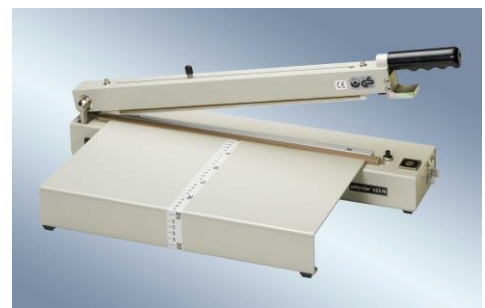
polystar ® 423 M mit SV + AT

www.polystar-hamburg.de eMail: info@polystar-hamburg.de