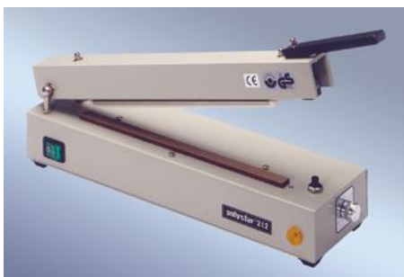
polystar ® 242