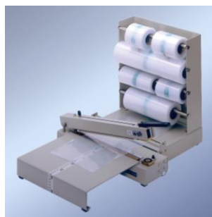
243 M m. SV, Magazin + AT